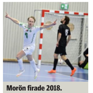
Morön firade 2018.

Sunnanå hoppas på ett åttonde lag i damklassen, för att få två grupper med fyra lag i varje. Drömscena-