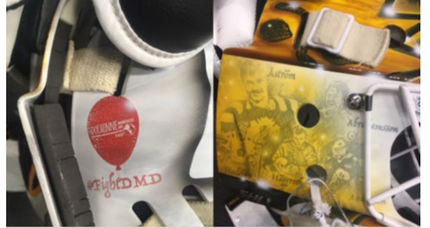
På Gustaf Lindvalls mask finns ett viktigt budskap.